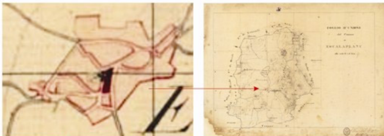
Fig. 1 Particolare ingrandito dell'abitato di Escalaplano ricavato dalla mappa Quadro di Unione del 31 dicembre 1844 - Archivio di Stato di Cagliari - fondo Real Corpo di Stato Maggiore - serie 058/001 )